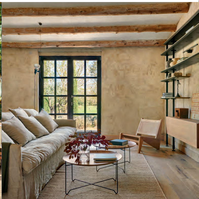
En el jardín destaca una mesa realizada con tableros de pino reciclado diseñada por Carme Pardo. La rodean varias sillas Palissade, de los Bouroullec para Hay. En el estar, el sofá Linus, de Atemporal, se enfrenta a la estantería Airport, de Giorgio Cattelan para Cattelan Italia.