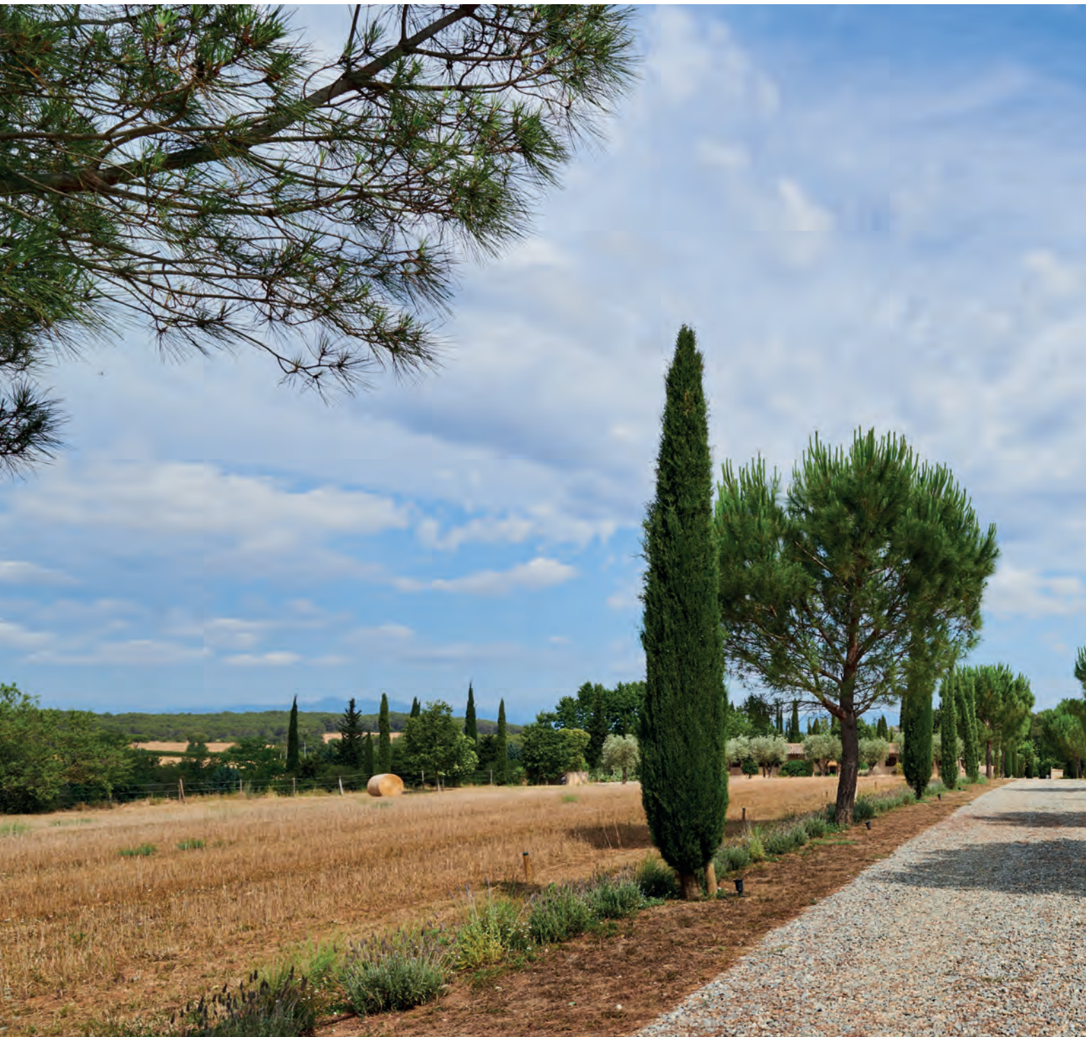
La casa cuenta con dos caminos de acceso. En este, en el que se plantaron diez cipreses, el paisaje es cambiante, pues a comienzos de